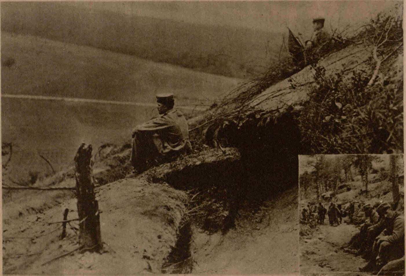
Deutsche Soldaten sehen aus eroberten französischen Stellungen an der Côte Lorraine ins französische Land hinaus. L. Pr. B. Eingefügtes Bild: Ruhepause im französischen Schützengraben