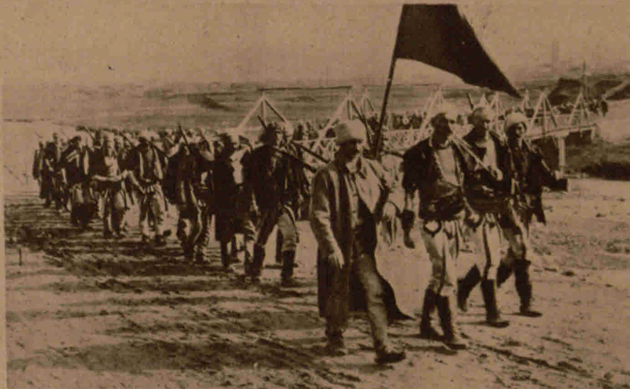
Albanische Freiwillige als Hilfsstruppen der Oesterreicher auf dem Marsch nach Durazzo