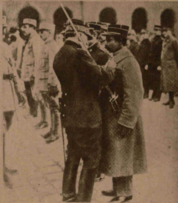
Ein Neger als Leutnant im französischen Heer