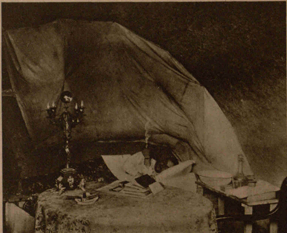
Feierabend im Offiziersunterstand (in einer Sandhöhle).

Eine neuartige Kombination von Schußwaffe und Feldstecher ist in Amerika patentiert worden. Der Feldstecher läßt sich sowohl allein, wie auch in Verbindung mit einer Büchse verwenden; die letztere wird zwischen den beiden Fernrohren angebracht. Die ruhige, sichere Lage der Büchse wird gewährleistet durch ein gegen die Stirn gedrücktes Rückschlagkissen. Den Rückschlag nimmt eine Reihe flacher Federn auf, die gleich den Federn eines Wagens angeordnet sind, und weiterhin eine weiche Lederpolsterung, welche