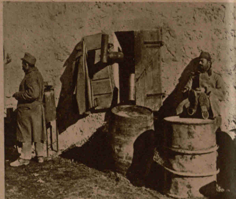
In der Märzsonne Albaniens. Ausrufender Bosniak