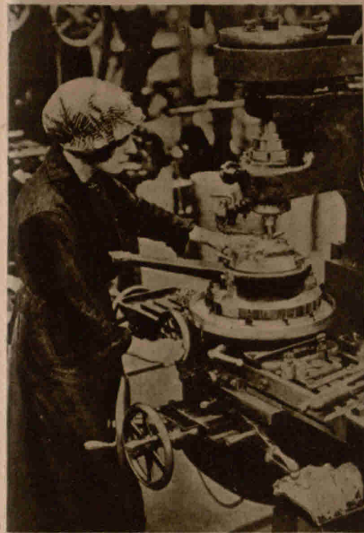
Bei der Herstellung von Spiralen aus starkem Stahldraht

Lord George, der englische Munitionsdirektor, hat zur Veranschaulichung des von ihm Erreichten ein illustriertes Werk „Frauenarbeit in Munitionsfabriken“ herausgegeben, welchem auch unsere Bilder entnommen sind. In diesen Fabriken werden dem amtlichen Bericht zufolge u. a. frühere Putzmacherinnen, Wäscherinnen, Textilarbeiterinnen, Dienstmädchen, Kontoristinnen, Verkäuferinnen, Studentinnen, Künstlerinnen, namentlich aber auch Soldaten-Frauen und Witwen, beschäftigt. Zu der Arbeit haben sich auch zahlreiche verheiratete Frauen gemeldet. Frauen bedienen beispielsweise Bohrmaschinen und Drehbänke zur Herstellung schwerer Granaten, selbst die Präzisionsarbeit der Anlegung der Führungsringe an die Granaten wird von Frauen zur vollen Zufriedenheit der Ingenieure geleistet, wie sich überhaupt die Leiter der Werkstätten und die Regierungsbeamten mit höchster Anerkennung über diese Frauenarbeit äußern. So sollen beispielsweise auch bei der Abnahme und der dabei notwendigen genauen Untersuchung der Granaten die Frauen besser zu verwenden sein als männliche Arbeiter. Allerdings muß man den Frauen die besten Hilfsmittel zur Verfügung stellen, da ihnen sonst die Arbeit viel zu schwer werden würde.