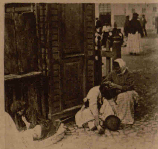
Von unserem neuesten Feinde: Bild aus dem Straßenleben in einer portugiesischen Stadt B. I. O.