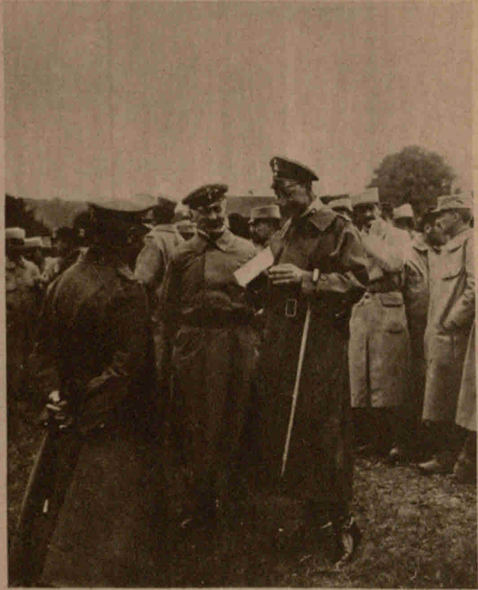
Links: Generalfeldmarschall Graf Häßeler inmitten eines Transports französischer Gefangener. Rechts: Der Kronprinz erhält einen Funkspruch. Im Hintergrunde französische Gefangene