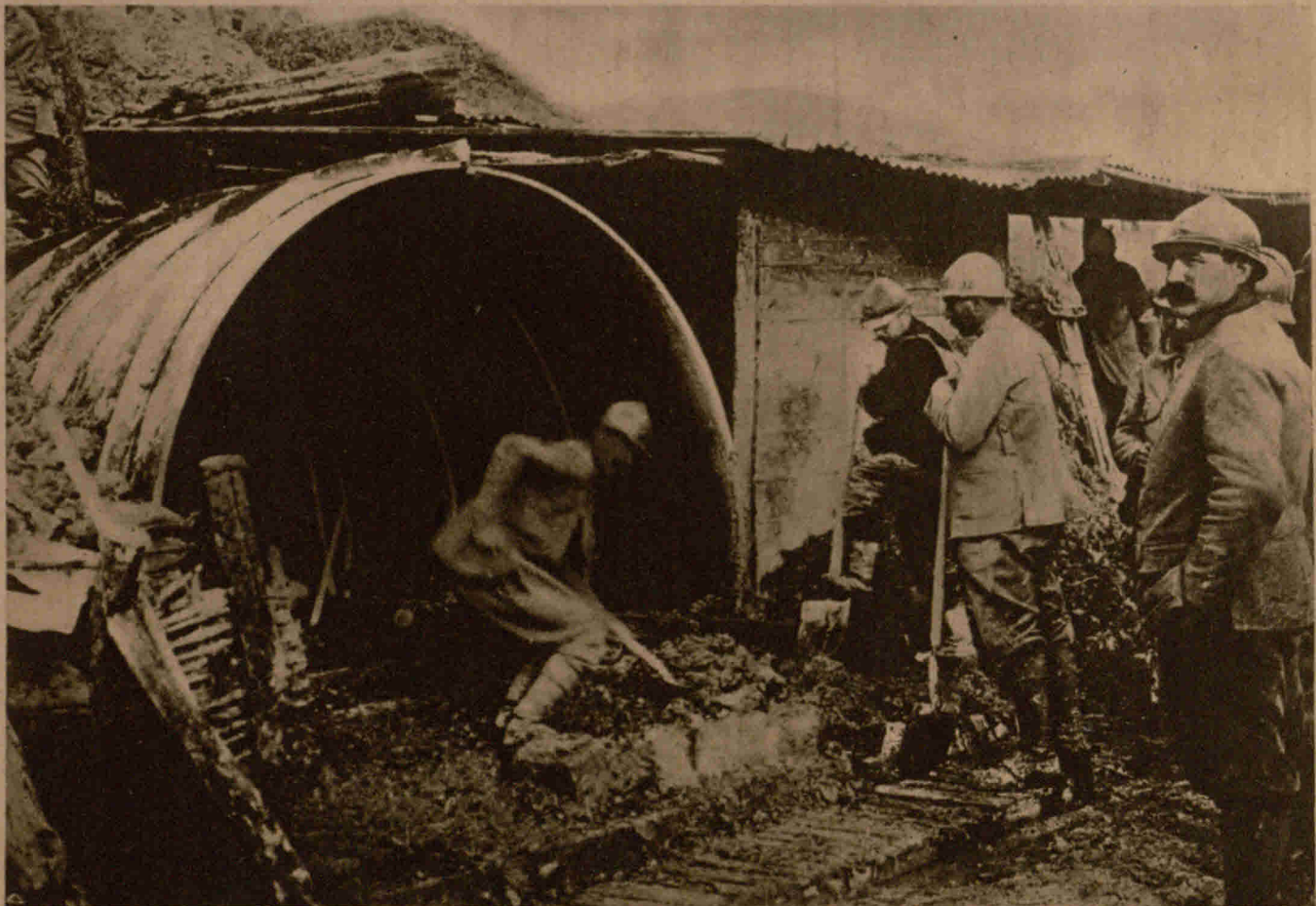
Bei Verdun. Die Franzosen bauen granaten- und bombensichere Unterstände, um für die zurückgehenden Truppen eine fertige zweite Verteidigungslinie bereitzuhaben