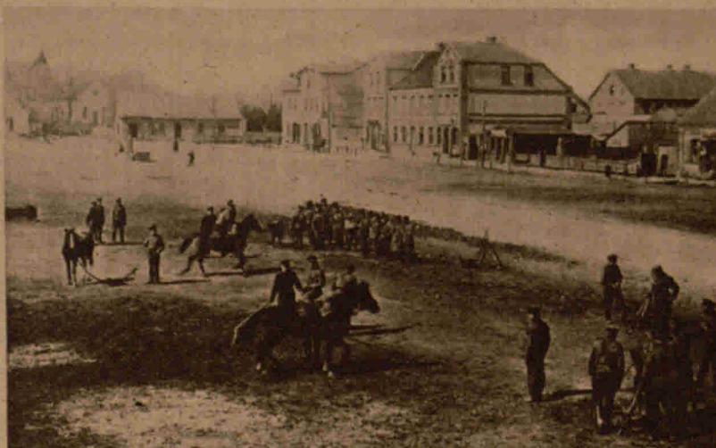
Der russische Jahrgang 1917 in der Ausbildung

gabe üblich, den Deforrierten umarmte und auf beide Wangen küßte. — Der formelle Ausbruch des Krieges zwischen dem Deutschen Reich und Portugal hat, wie man wohl sagen darf, beim deutschen Volke keine tiefgehende seelische Erschütterung ausgelöst. Dem kulturellen Stande nach stehen die Portugiesen in ihrer großen Masse weit unter den Balkanvölkern, bei denen wenigstens das Streben zur Kultur in Erscheinung tritt. Unser Bild aus Portugal illustriert anschaulich des Landes Brauch und Sitte.