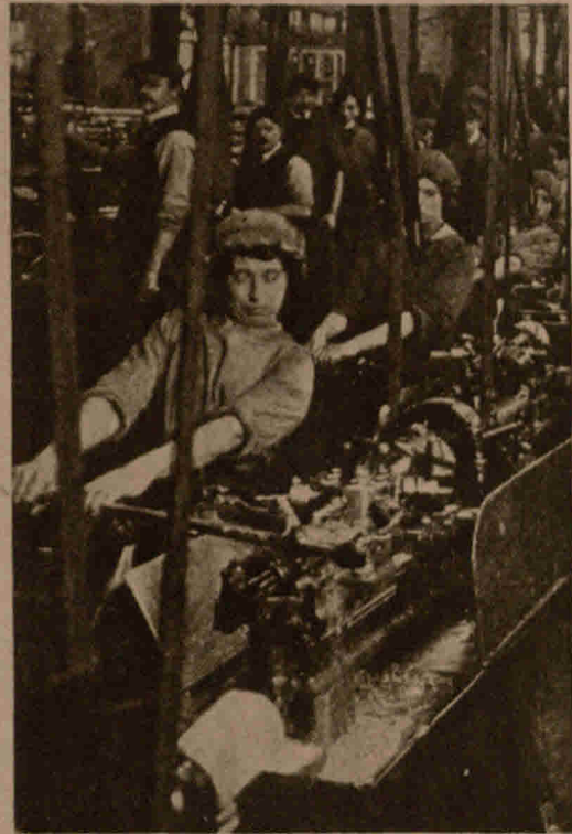
An der Drehbank. Der Gesichtsausdruck der Arbeiterin läßt auf die Schwere der Arbeit schließen

Lord George, der englische Munitionsdirektor, hat zur Veranschaulichung des von ihm Erreichten ein illustriertes Werk „Frauenarbeit in Munitionsfabriken“ herausgegeben, welchem auch unsere Bilder entnommen sind. In diesen Fabriken werden dem amtlichen Bericht zufolge u. a. frühere Putzmacherinnen, Wäscherinnen, Textilarbeiterinnen, Dienstmädchen, Kontoristinnen, Verkäuferinnen, Studentinnen, Künstlerinnen, namentlich aber auch Soldaten-Frauen und Witwen, beschäftigt. Zu der Arbeit haben sich auch zahlreiche verheiratete Frauen gemeldet. Frauen bedienen beispielsweise Bohrmaschinen und Drehbänke zur Herstellung schwerer Granaten, selbst die Präzisionsarbeit der Anlegung der Führungsringe an die Granaten wird von Frauen zur vollen Zufriedenheit der Ingenieure geleistet, wie sich überhaupt die Leiter der Werkstätten und die Regierungsbeamten mit höchster Anerkennung über diese Frauenarbeit äußern. So sollen beispielsweise auch bei der Abnahme und der dabei notwendigen genauen Untersuchung der Granaten die Frauen besser zu verwenden sein als männliche Arbeiter. Allerdings muß man den Frauen die besten Hilfsmittel zur Verfügung stellen, da ihnen sonst die Arbeit viel zu schwer werden würde.