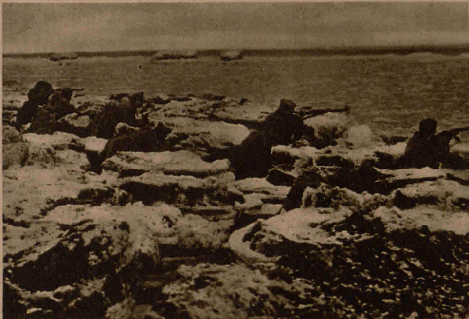
Die Wacht im Osten. Deutsche besetzte Stellungen am kurländischen Ostseestrande

seinerzeit zur Erinnerung an den Vertrag von Verdun stiftete, durch welchen im Jahre 843 die Trennung zwischen dem Deutschen Reich und dem Frankenreich vollzogen wurde. Dieser Preis wird für wissenschaftliche Arbeiten in der geschichtlichen Forschung verliehen. Verdun war übrigens bis weit in das Mittelalter hinein deutsche Reichsstadt und wurde erst im Westfälischen Frieden 1648 förmlich an Frankreich abgetreten.