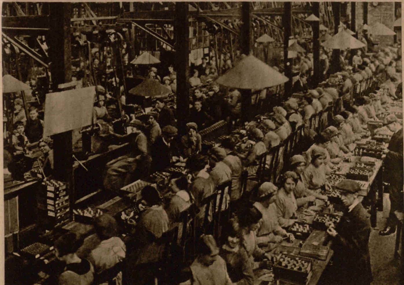
rechts und in der Mitte, in der Nähe des Glasbaues, sieht man Kinder bei der Arbeit