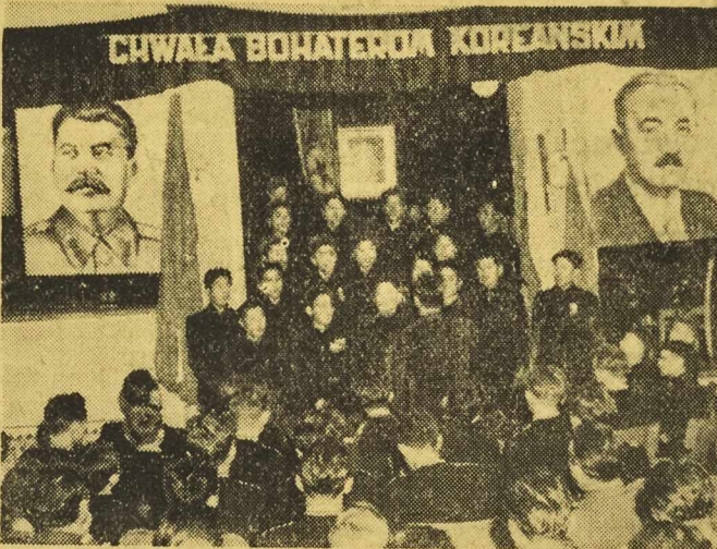
19 młodych Koreańczyków (do niedawna żołnierzy Koreańskiej Armii Ludowej), którzy przybyli na studia do Polski, spotkali się z młodzieżą z Korpusu Kadetów im. Gen. Świerczewskiego. Goście koreańscy opowiedzieli kadetom o swym udziale w bohaterstwie w walce, jaką toczy ich naród przeciw najęźdźcy amerykańskiemu. Na zdjęciu: Młodzi Koreańczycy śpiewają. Kantata o Stalinie.

Przyrzekamy Ci, Obywatelu Prezydencie, wykorzystując osiągnięcia metodologiczne konferencji, rozwijać polską naukę historyczną, krytycznie i samokrytycznie ustosunkowywać się do naszej pracy, aby dać narodowi polskiemu jak najpełniejszy obraz jego wielkiej przeszłości, bohaterstwa i walki polskiego mas ludowych i wkładu polskiego w dzieło ludzkości, aby ujawnić przed narodem wszystkie te ciemne siły, które w służbie rodzimych i obcych wyzyskiwaczy ciągnęły wstecz nasz naród. W ten sposób przyczynimy się do tym mocniejszego zespolenia ideowego wszystkich uczciwych Polaków przeciwko anglo-amerykańskim imperialistom i ich polskim najomom, zespolenia naszego społeczeństwa w narodowym froncie walki o pokój i realizację Planu 6-letniego.