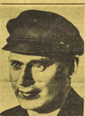
Dnia 16 kwietnia 1886 roku urodził się Ernest Thaelmann, przywódca Komunistycznej Partii Niemiec — zamordowany przez hitlerowców w 1944 roku po 11-letnim więzieniu

D ZIEKI sprzyjającej pogodzie siewy w całym kraju są w pełnym toku. Wykonując zobowiązania podjęte masowo dla uczczenia 60 rocznicy urodzin Prezydenta Bieruta i Święta 1 Maja, chłopci gospodarujący indywidualnie, członkowie spółdzielni produkcyjnych, załogi PGR, POM i SOM przyspieszają prace siewne, świadomi, że szybki i staranny zasiew gwarantuje wyższe urodzaje.