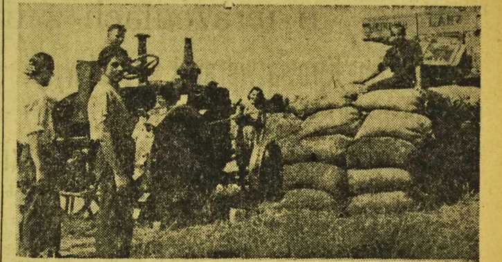
Spółdzielcy z Gądkowa (pow. Legnica) młóć „od ręki” żaraz na polu.

O SWICIE drogą wiodącą do Mierczyc, jechało kilka solidnie obciążonych wozów. — Hej, Wojciechu, a będziemy to pierwszy, na punkcie, czy nie będziemy? — krzyknął jeden z woźniców do swego sąsiada. — Czy aby nas kto nie ubiegł? — E, tam zaraz ubiegł! — odpowiedział zapytany. — Bieleńscy jeszcze wszystkie z pola nie zebrali. Z młóćką też jeszcze się nie uporali. A przecież kto jak kto, ale oni mogliby nam zagrozić.