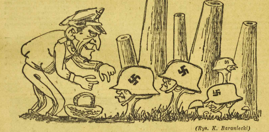
(Rys. K. Baraniecki)

N A wzniesienie „Madame Butterfly” szłam z dużym zainteresowaniem. Niech mówi kto chce, niech opowiada o tej operze, że jest melodramatyczna, brutalna, pełna naturalistycznych efektów, a jednak można jej słuchać i co dziwniejsze oglądać ją po wiele razy, wynajdując zawsze nowe wartości, nowe wzruszenia.